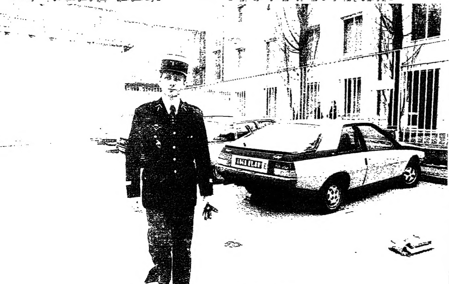
قائد الشرطة في الفوج - واتيمه المحامون بدور مشهود في تصفية لاروش